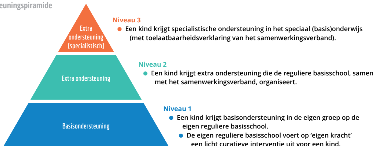
Figuur 1 Ondersteuningspiramide

Ons Kindcentrum heeft een ondersteuningsteam . Daarin zitten de leerkracht en de intern begeleider, zo nodig aangevuld met specialisten uit onze eigen school of externe mensen met bepaalde expertise, zoals de (school)maatschappelijk werker, de jeugdverpleegkundige en de Steunpunt Coördinator . Soms kunnen ook andere externe deskundigen aanschuiven.